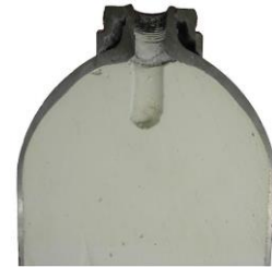
Schnitt einer C 2 H 2 -Flasche

Trotz des oben erwähnten Sicherheitssystems kann es unter ungünstigen Umständen zu einer Zerfallsreaktion im Flascheninnern kommen.