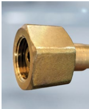
Csatlakozás más gázok esetében horony nélkül