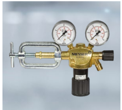
Kengyeles szelepcsatlakozás acetilén gázpalackokhoz

Az éghető gázok palackjainak esetében a szelepcsatlakozások balmenetűek , míg az összes többi gáz esetében jobbmenetűek . Az éghető gázokhoz való nyomáscsökkentők a csatlakozó-anyán lévő horonyról is felismerhetők .