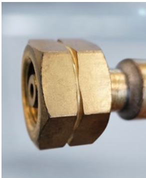
Csatlakozás éghető gázok esetében horonnyal