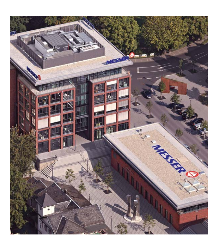
Bad Soden, svibanj 2023. godine Messer SE & C o. KGa A

na webu pod: www.messer.ethicspoint.com ili putem telefona: (telefonski brojevi za Vašu zemlju naći ćete na web stranici.)